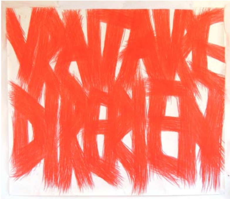
Vrai , 2015 craie de forestier sur papier, 210 x 240 cm