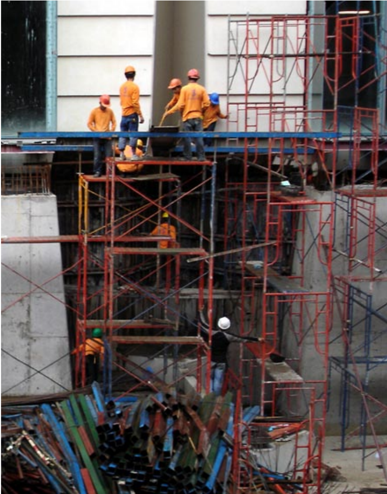
Archive photographique, 2011